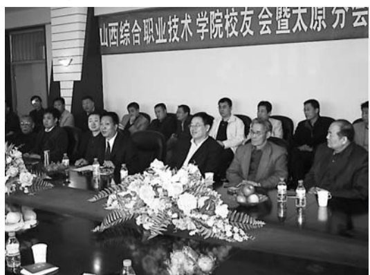
3月30日,我院召开校友会暨太原分会成立大会。

菁菁校园,绿树成荫,校舍巍然,名师荟萃,俊彦云集,这就是我们美丽的校园,可爱的家——山西综合职业技术学院。