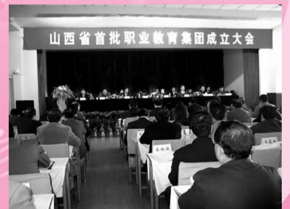
山西省首批职业教育集团成立大会 山西省教育厅成立的八个省级职业教育集团，3月25日在省教育实训馆举行了隆重授牌仪式。由我院牵头成立的“山西省材料与信息职业教育集团”，作为八个省级职业教育集团之一，参加了授牌仪式。